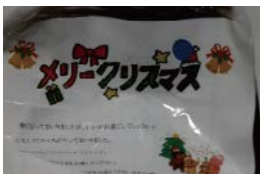
クリスマスプレゼント

せて頂いております。密にならないため教室形式のテーブルの配置としています。参加者のうち希望者は神出の4つの老人施設の送迎付きです。食事後のレクリエーションでは音楽ショーや神戸市や認知症地域支えあい推進事業からの出前トーク等の話しに聞き入っておられました。また、ひとり暮らし及び老々世帯の高齢者の方に9月の敬老祝いはミニゴルフを12月のクリスマスでは靴下を配りました。