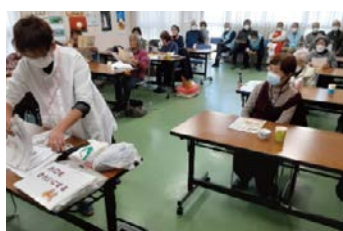
会食会レクリエーション

毎年恒例のもちつき大会(1月25日)では子供さんたちが楽しそうに餅をついたり丸めたりしました。終了後はついたもちを持って帰っていただきました。