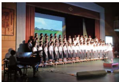
文化祭 全校合唱「ふるさと」

との歌詞とが重なり、涙がこぼれました。その後のあいさつでは感動のあまり声が上がってしまったが、恥ずかしい姿を見せてしまいました。が、思わず「これが、この子たちが神出の未来です」と言っていました。私は神出の生徒たちを縁の竹にたとえ真つすく伸び、しなやかに風や雪の重みにも耐える強さを持つ人間に育ってほしいと願っています。着実にその願い通りに育ってきてくれると感じています。今、卒業の時期を迎え、3年生はそれぞれの進路に向かい巣立っていきますが、この子たちがいざまた大きく成長して神出に戻ってくることを信じています。今後とも神出の子供たちに、変わらぬご支援をどうぞよろしくお願いいたします。