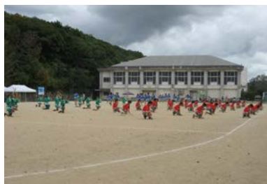
体育会 マスゲーム