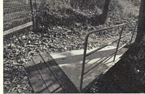
• 掛け溝の上に橋を渡しました。