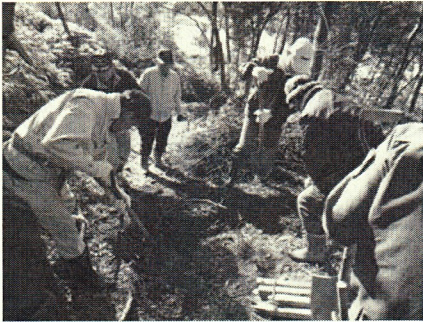
• 階段や土留めを設置しました。