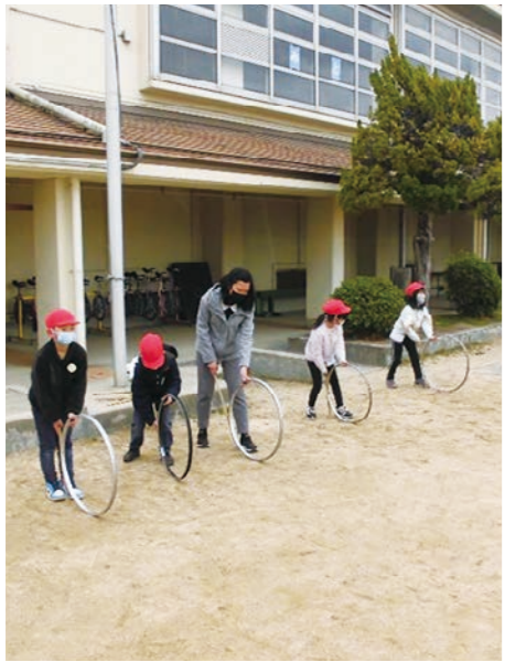
一年生は外国の先生に日本の昔の遊びと一緒に遊びました。